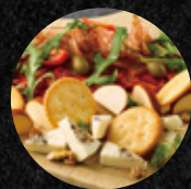
臘腸起司盤 Artisanal Meat & Cheese Board