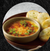
獨家鴨肝烤布蕾 Exclusive Foie Gras Brûlée