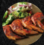
Buckskin 蜜烤雞翅 Buckskin Honey Baked Chicken Wingettes