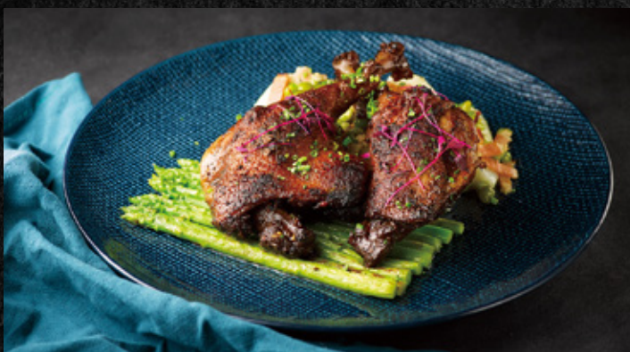
德式黑啤酒油封鴨腿 德式黑啤, 櫻桃鴨腿, 低溫油封

Duck Confit Sous Vide Duck Confit with Schwarzbier