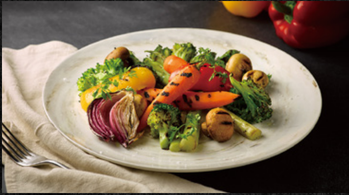
炙燒蔬菜盤佐風味鹽 綜合季節時蔬

Grilled Vegetables Platter Seasonal Vegetables