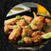
炸雞歡樂拼盤 Fried Chicken Platter