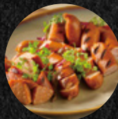
德國風味香腸盤 Sausage Platter