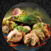
松露蕈菇雞腿捲 Truffle Chicken Roulade