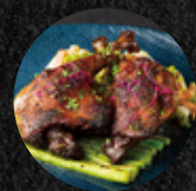
德式黑啤酒油封鴨腿 Duck Confit