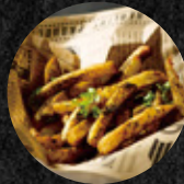
黑麻麻薯條 Dirty Fries