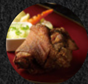
Buckskin酥烤豬腳 Buckskin Crispy Grilled Pork Knuckle