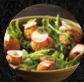
炸乳酪薯球 Fried Cheese Potato Balls