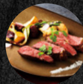
燒烤牛肩胛 Char-Grilled Beef Chuck