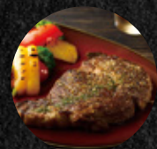
香煎牛肋眼 Pan Fried Boneless Beef Rib Eye