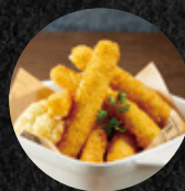
炸起司條 Fried Mozzarella Cheese Sticks