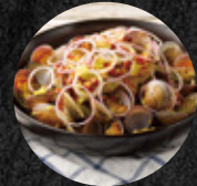
小麥啤酒風茴香炒海蛤 Stir-fried Clams with Hefeweizen