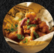
風味炸中卷圈 Fried Calamari