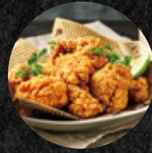
炸雞米花 Fried Popcorn Chicken