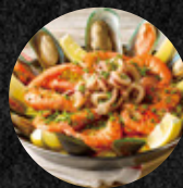
海之盛宴番紅花燉飯 Seafood Extravaganza