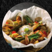
紙包蒸烤綜合海鮮 Steamed Mixed Seafood