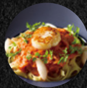
奶油蕃茄蟹肉干貝寬麵 Crab Meat & Scallop Fettuccine