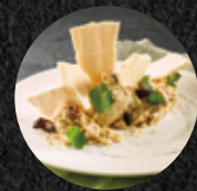
手工起司蛋糕 Homemade Cheese Cake