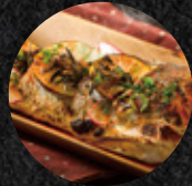
時令季節烤半魚 Baked Seasonal Fish