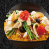
雞肉南瓜燉飯（可全素） Pumpkin Chicken Risotto (Vegan option available)