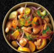
櫛瓜橄欖蟹肉沙拉 Crab Meat Salad with Squash & Black Olive