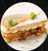
蘋果卡士達千層 Apply Custard Mille Feuille