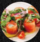
燻鮭魚香草起士捲 Smoked Salmon Bites