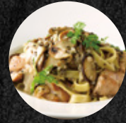
松露奶醬雞肉寬麵 Truffle Fettuccine with Grilled Chicken