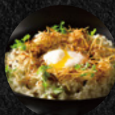
什錦野菇半熟蛋燉飯 Wild Mushroom Risotto