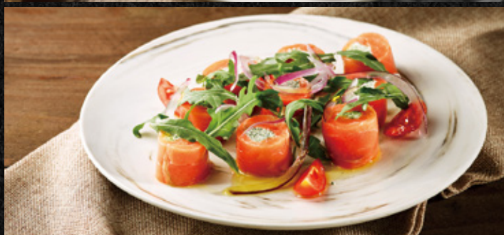
燻鮭魚香草起士捲