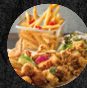
豪華炸物拼盤 Deluxe Fried Party Platter