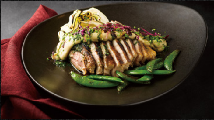
煙燻啤酒風煎豬腩排 煙燻啤酒, 黑麥汁, 低烹慢煮