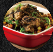
威士忌酥炸骰子牛 Whisky Infused Beef