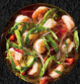
庫斯庫斯鮮蝦沙拉 Shrimp Couscous Salad