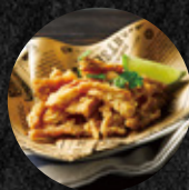
炸雞軟骨 Fried Chicken Cartilage