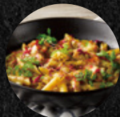
青醬海鮮焗烤筆管麵 Penne Grilled with Cheese & Pesto