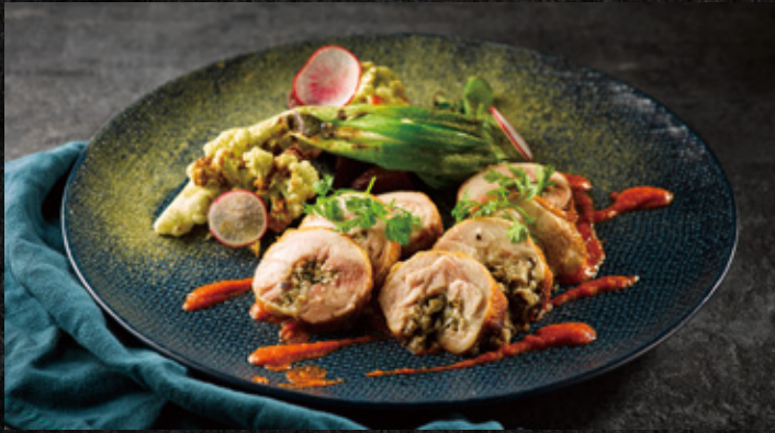
松露蕈菇雞腿卷 松露野菇, 低溫慢煮, 辣味培根紅醬

Truffle Chicken Roulade Truffle Mushrooms, Slow Cook with Spicy Bacon Red Sauce