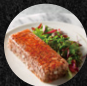
Buckskin啤酒肉凍 Buckskin Beer Flavored Ham Jelly