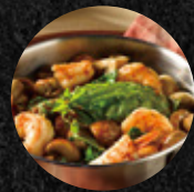
Buckskin 蘑菇啤酒蝦 Buckskin Shrimps & Mushrooms