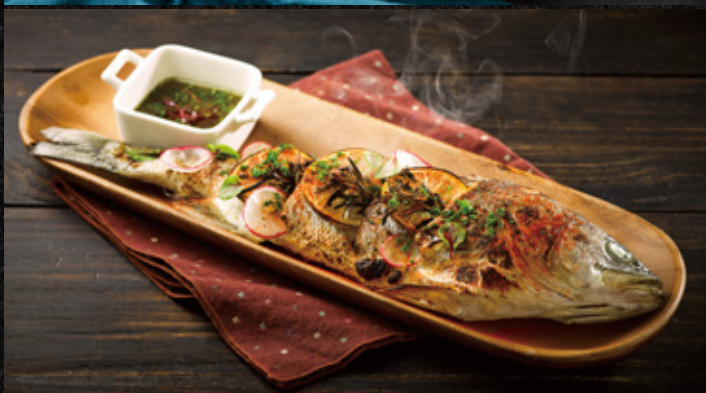
時令季節烤半魚 季節鮮魚, 新鮮香料, 特製香草醬

Baked Seasonal Fish Seasonal Fish, Spices & Special Vanilla Sauce