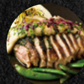
煙燻啤酒風煎豬腩排 Smoky Pork Belly